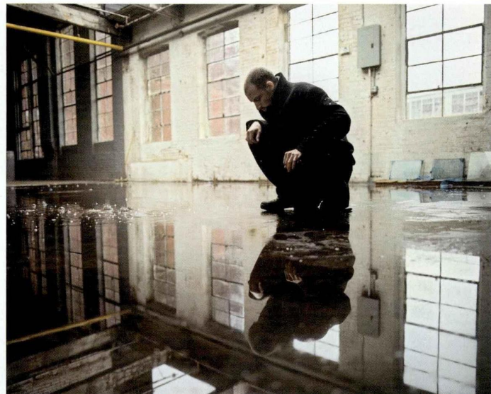
Ci-contre Annexe - Aporie 3 (1 x 2) , 2019, 65 x 77,5 cm.